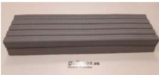
Superpuestas para aumentar grosor