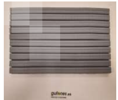
Juntas en paralelo