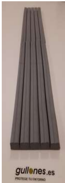
Juntas aumentando largo